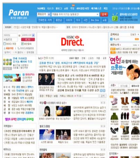
< 개편 전 >