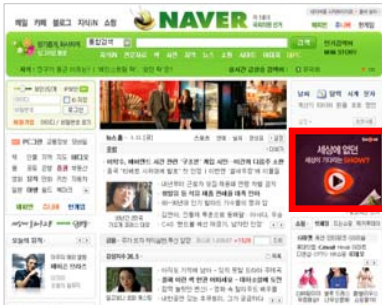
<마우스 오버 시 세로 확장되며 '펼쳐보세요' 버튼 생성>