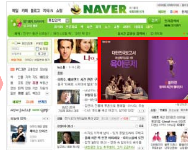
<한 장을 넘겼을 경우>