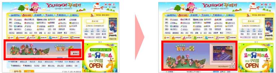
〈'펼쳐보기' 버튼 클릭 시〉