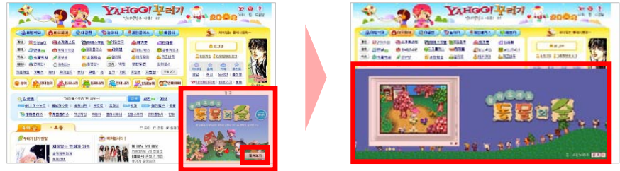
〈'펼쳐보기' 버튼 클릭 시〉