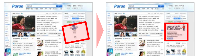
〈1회 회전 후 메인배너 노출〉