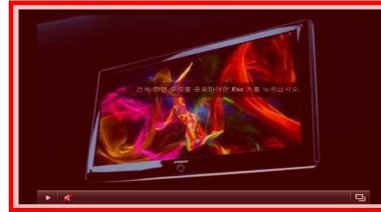
<버튼 클릭 시>