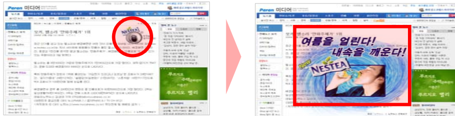
<아이콘 클릭 시>