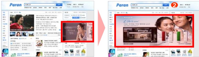
〈플러스 여백배너 클릭 시〉