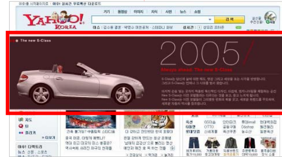
(마우스 오버 시)