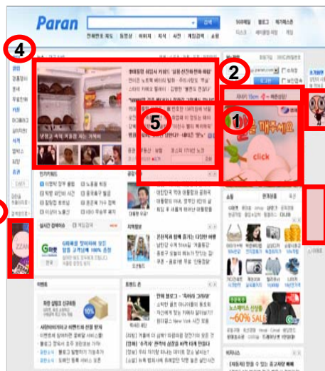
< 개편 후 >