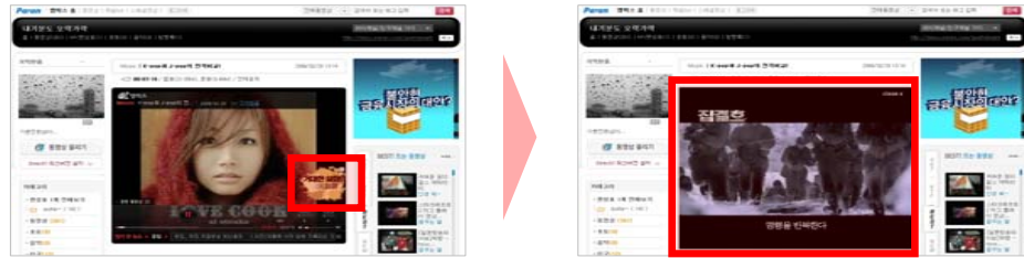
〈아이콘 클릭 시〉