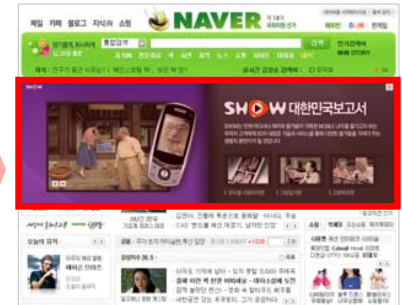
<두 장을 넘겼을 경우>