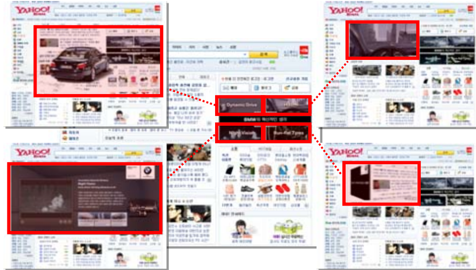
〈 각 영역을 클릭 시, 각기 다른 크리에이티브 구현〉