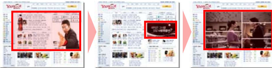
〈 플로팅 1회 구현 후, H배너로 수렴〉 〈마우스 오버시 확장됨〉