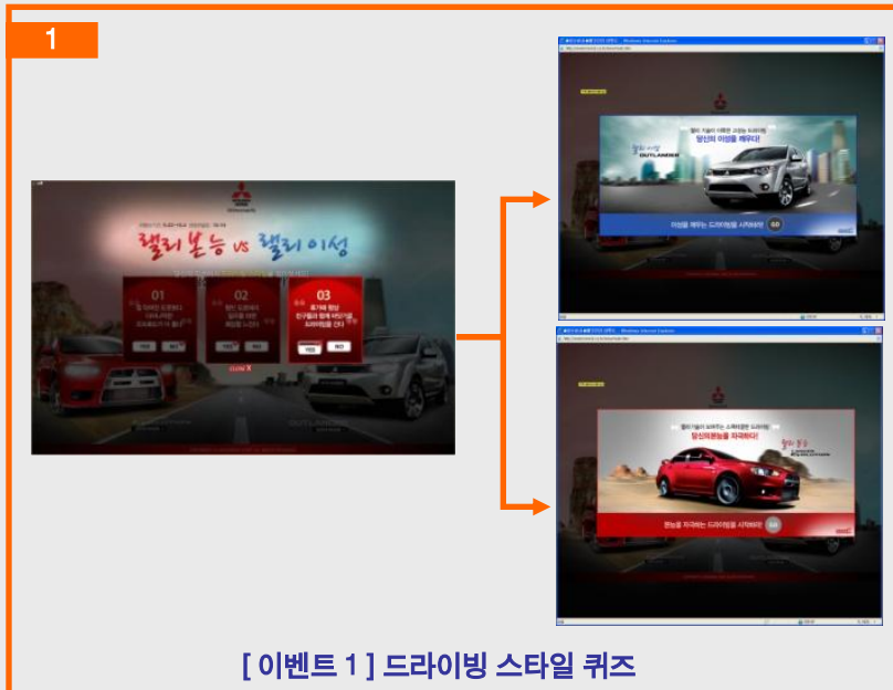
[ 이벤트 1 ] 드라이빙 스타일 퀴즈