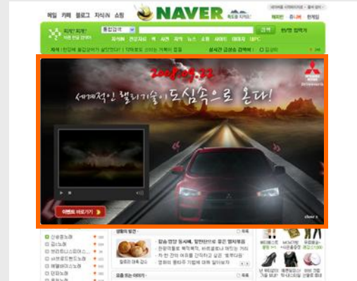
[네이버 브랜딩보드 드래그형]