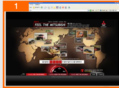
[ 이벤트 1 ] FEEL THE MITSUBISHI