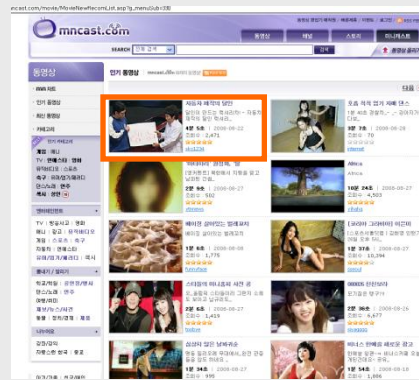
[ 엠엔캐스트 초기 및 서브 지면 인기/추천 동영상 노출 영역 ]