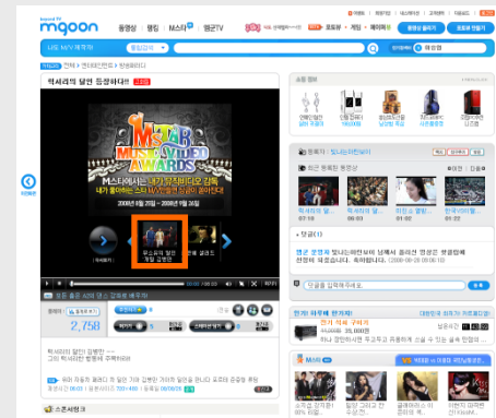
[ 엠군 초기 및 서브 지면 인기/추천 동영상 노출 영역 ]