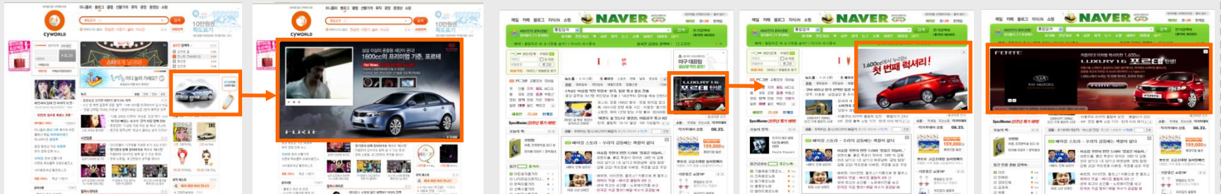
[ 싸이월드 브랜딩샷 드로잉형 ]