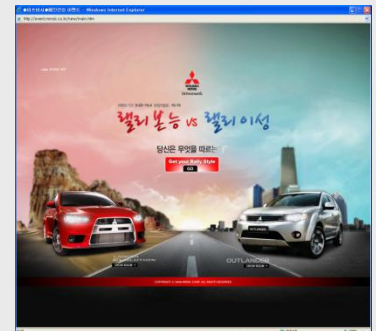
런칭 이벤트 페이지