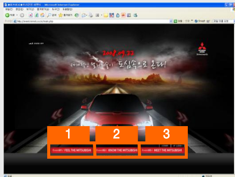
[ 프리 런칭 이벤트 페이지 ]