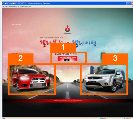
[ 런칭 이벤트 페이지 ]