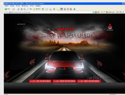
프리런칭 이벤트 페이지