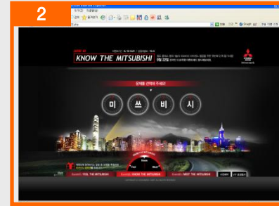
[ 이벤트 2 ] KNOW THE MITSUBISHI