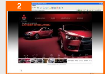
[ 이벤트 2 ] 랜서에블루션 쇼룸 페이지