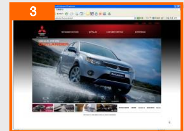
[ 이벤트 3 ] 아웃랜더 쇼룸 페이지