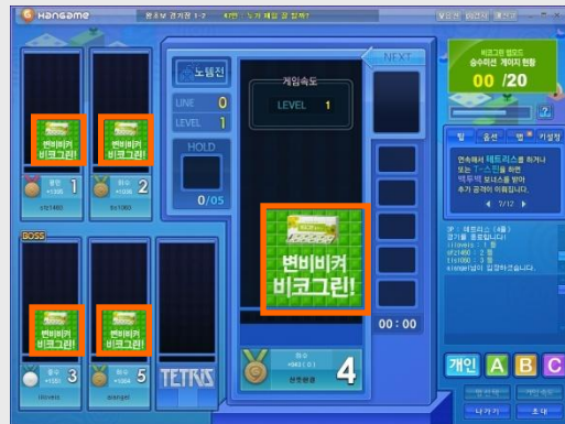
[ 테트리스 노렘전 비코그린 맵 ]