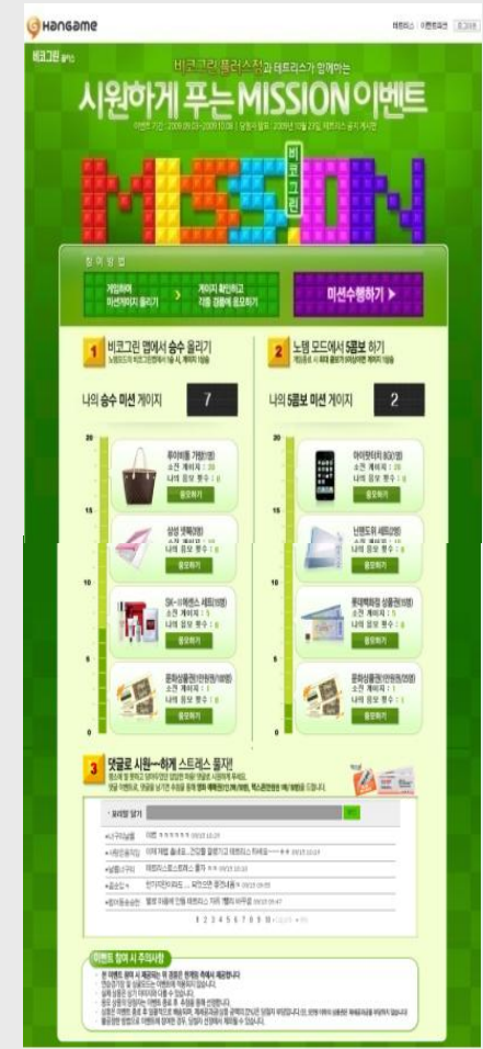
[한게임 테트리스 이벤트 페이지]