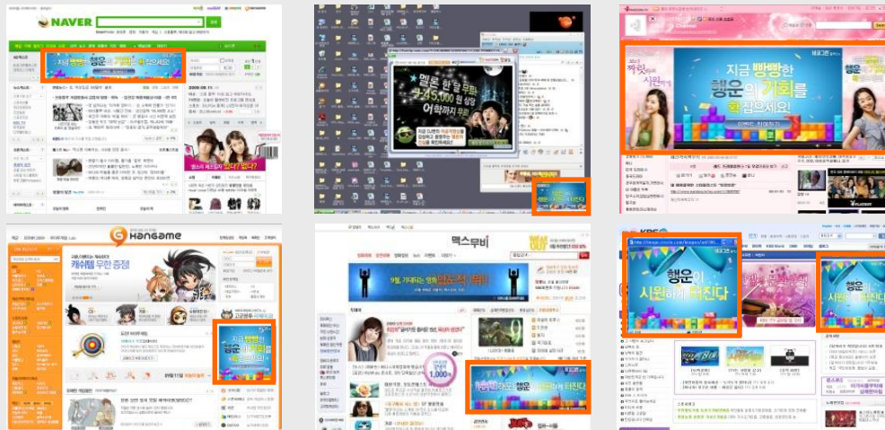
[보조 매체 활용]