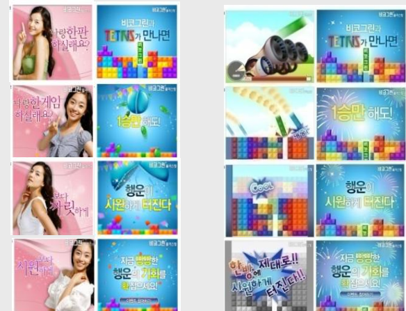
1차 - 모델 활용