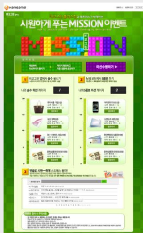
[ 테트리스 내 이벤트 페이지 ]