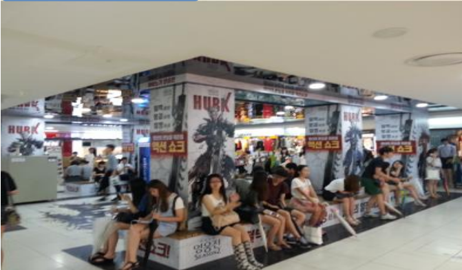
* 대형 의자 2기 + 기둥 6기의 랩핑형 광고