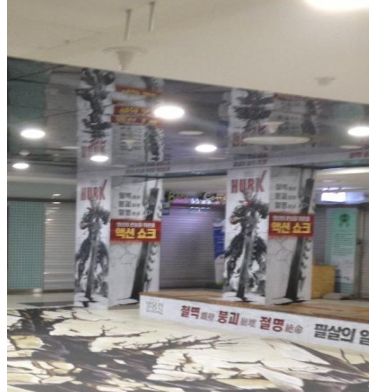
* 강남역 트릭아트 바이럴 영상 - 캐릭터 검으로 인한 바닥균열을 표현한 트릭아트로 기둥-바닥간 크리에이티브 연결