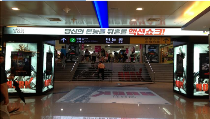
* 조명+영상+기둥+계단 통합 영역 외에 바닥지면을 최대한 활용, 게임 주요 이미지 임팩트 있게 전달