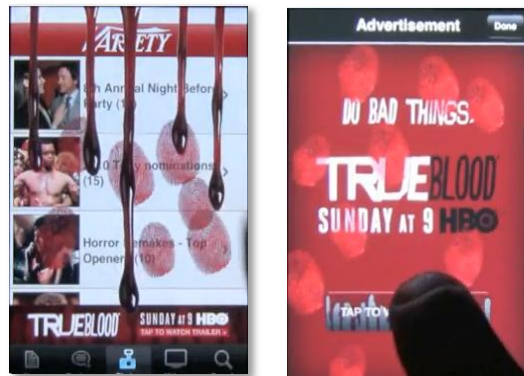
True Blood 캠페인