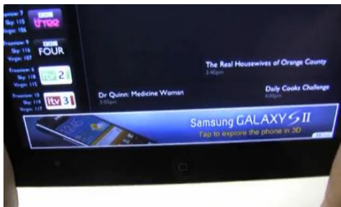
3D로 구현된 삼성전자의 갤럭시 광고