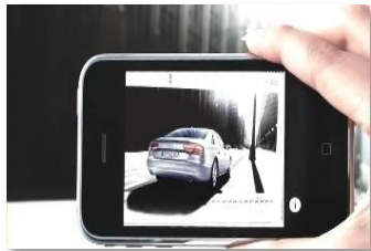
아우디 A1 캠페인