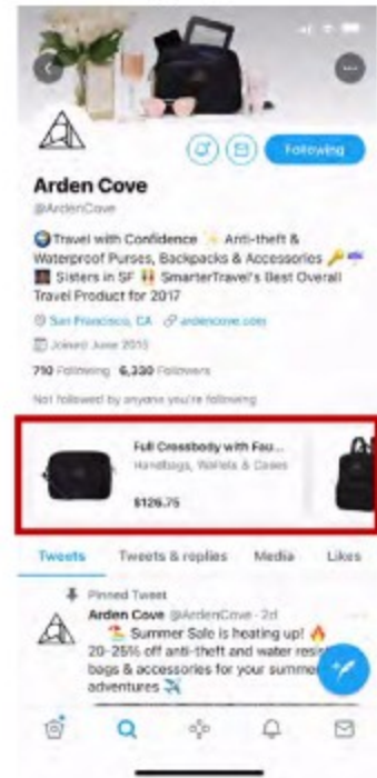
[ Live Shopping 개재 예시 ]