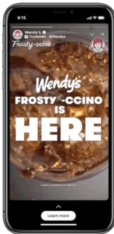
풀 스크린 광고 예시