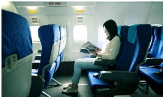
에어부산 - 무료 좌석 제공 이벤트

백신을 접종한 승객이 국내 내륙 노선을 이용할 경우 유상 좌석인 압좌석 또는 비상구 좌석을 추가 비용 없이 제공, 시주노선에는 '수하물 우선처리 서비스' 시행