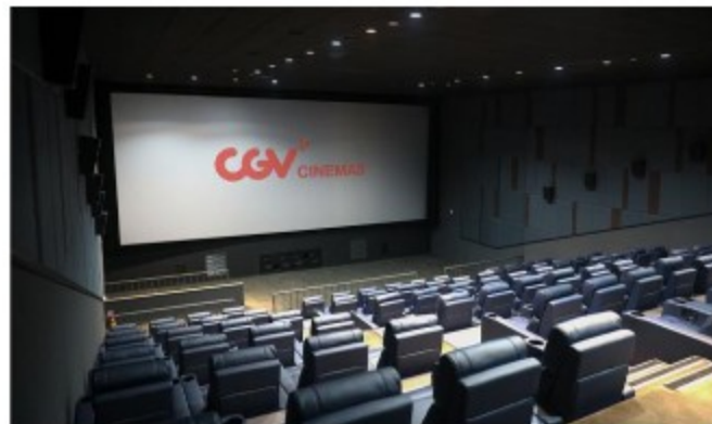
CGV - 영화 관람권 할인 프로모션

백신 접종자와 일행에게 평일 점심 뷔페 가격을 50% 할인된 가격에 제공, 5~6월 예약이 모두 마감될만큼 뜨거운 반응 기록