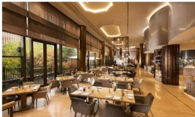
밀레니엄 힐튼 서울 - 식사 가격 할인 프로모션

백신을 접종한 승객이 국내 내륙 노선을 이용할 경우 유상 좌석인 압좌석 또는 비상구 좌석을 추가 비용 없이 제공, 시주노선에는 '수하물 우선처리 서비스' 시행