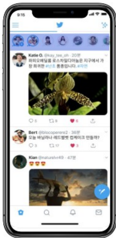
플릿 게시 위치