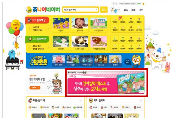
▷ 네이버 유니버 홈 확장 배너 활용