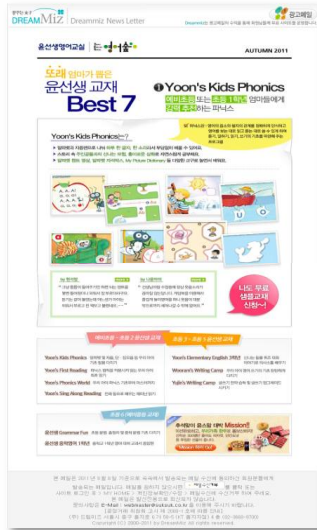
▷ 쓱쓱닷컴 DM 활용