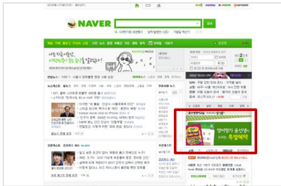
▷ 네이버 메인 롤링보드 활용