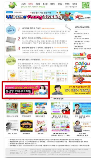
▷ 쓱쓱닷컴 뉴스레터 내 삽입배너 활용