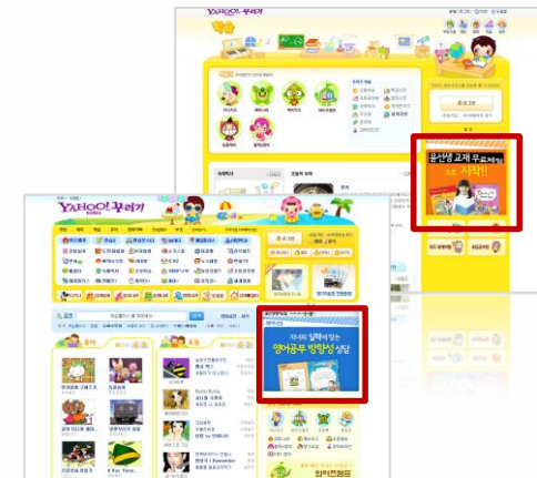
▷ 야후 꾸러기 메인/서브 지면 활용