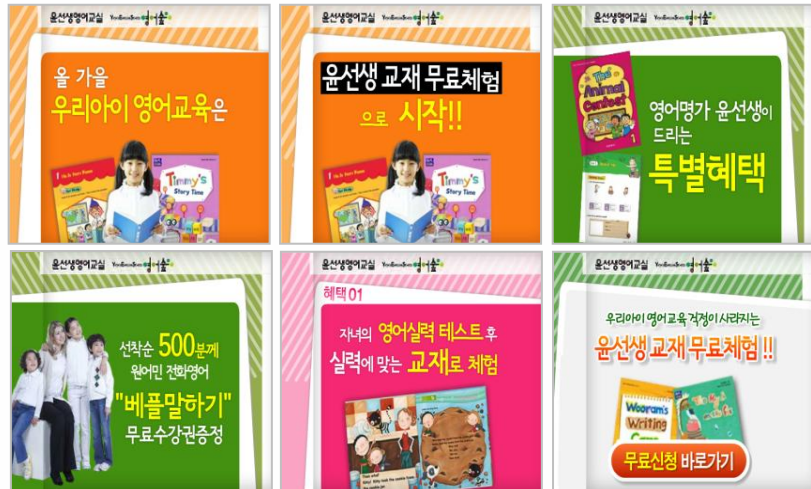
[ Banner Creative ]