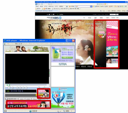
▷ KBS 인기 드라마 섹션 내 상품활용